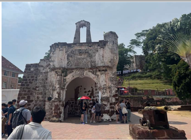
말라카 산티아고 요새*