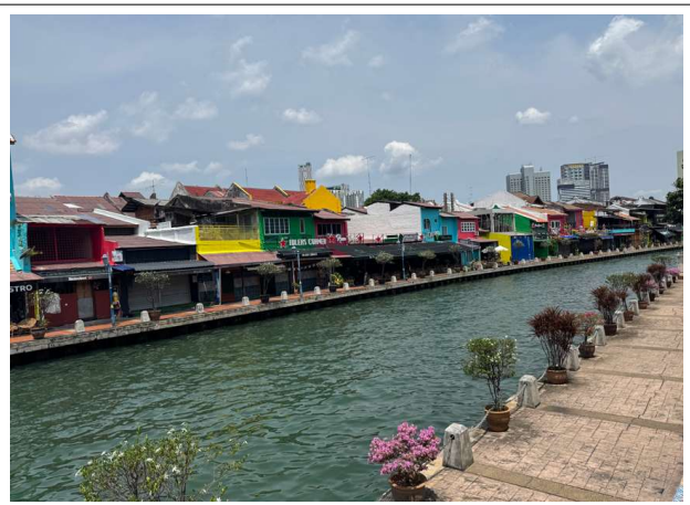
말라카 유네스코 유적지구 일원 답사