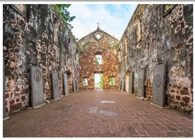
말라카 세인트 폴 교회**