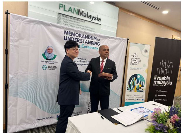
말레이시아 국토계획청 장관 미팅